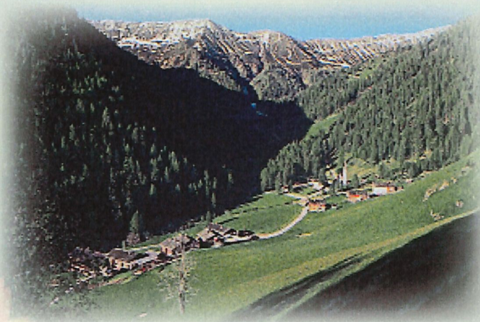
Blick auf Kalkstein